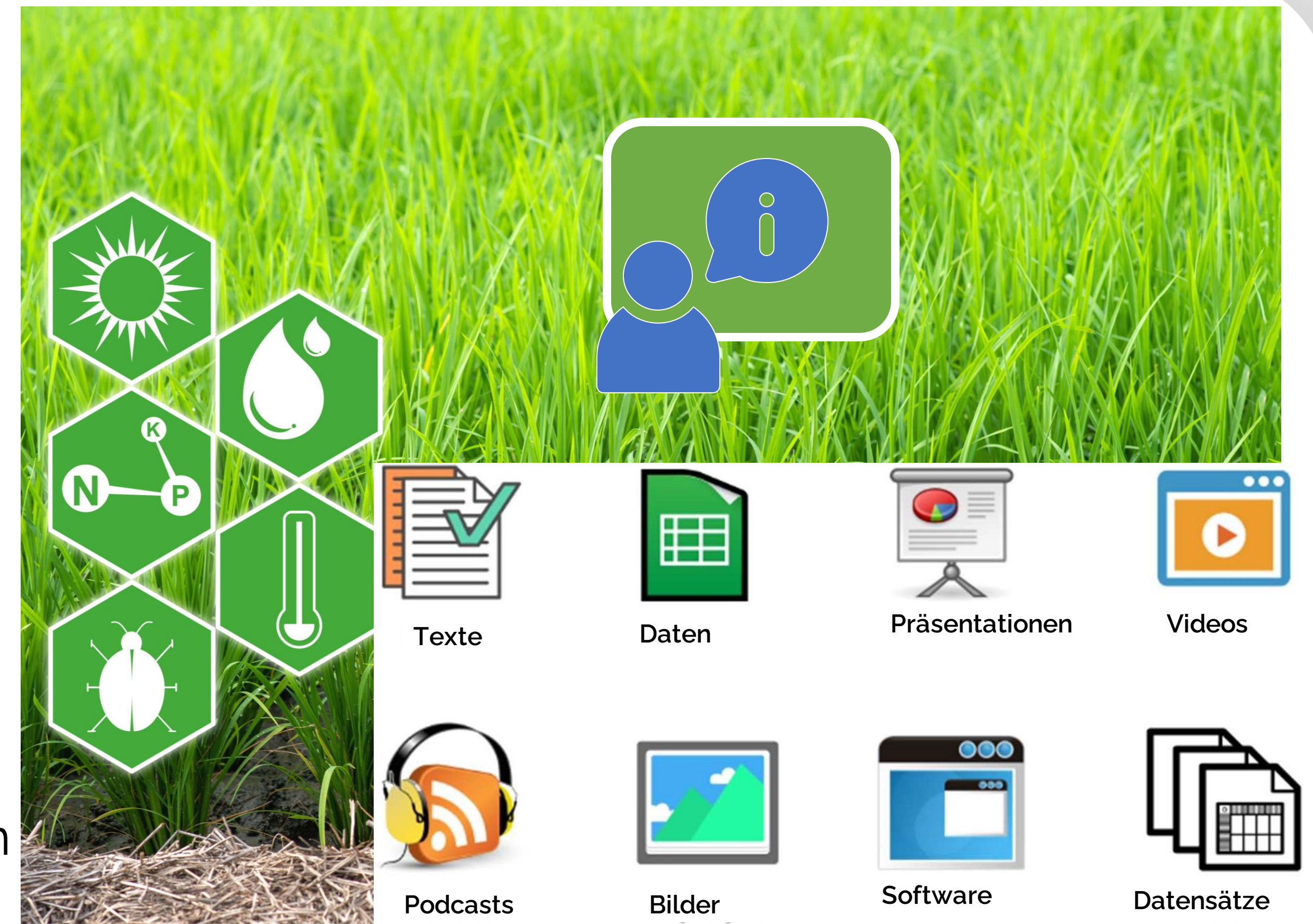
Abb. 1. Verschiedene Formate von Lern- und Trainingsressourcen, die auf der Plattform EU-FarmBook geteilt werden können.